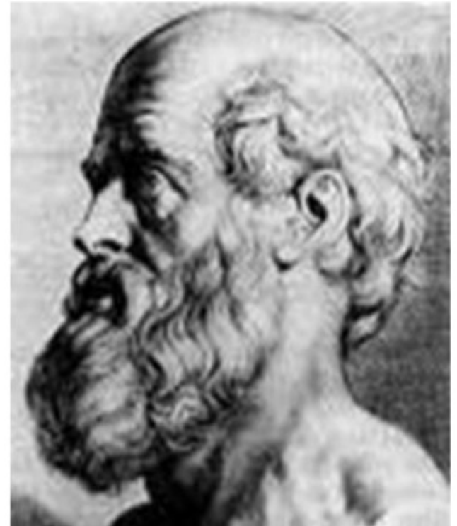
Hipócrates (460? - 377? antes de Cristo)

“El fundamento del amor al arte (médico), está en el amor al hombre”